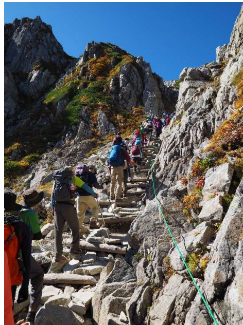
乗越浄土に向け登山