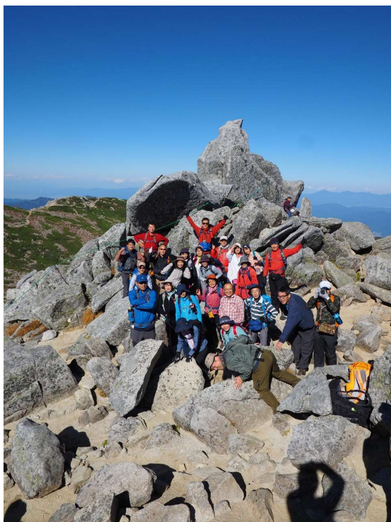
中岳(2925m)山頂で記念撮影