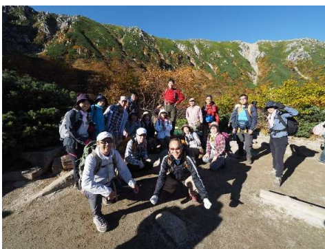
無事に下山しました